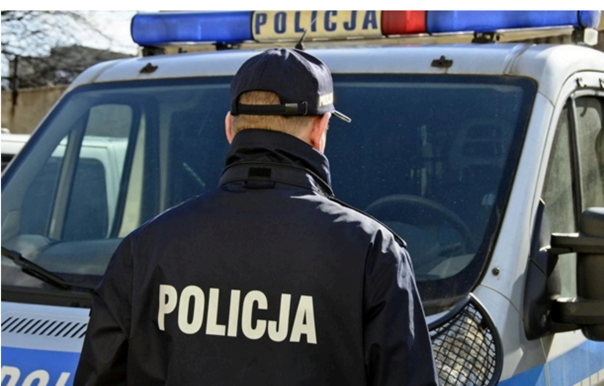
(ілюстраційне фото) У Вроцлаві викрали двох українців, вимагаючи від них грошей

Викрадачі змусили молодих чоловіків передати їм паролі до банківських додатків та позичити гроші у знайомих.