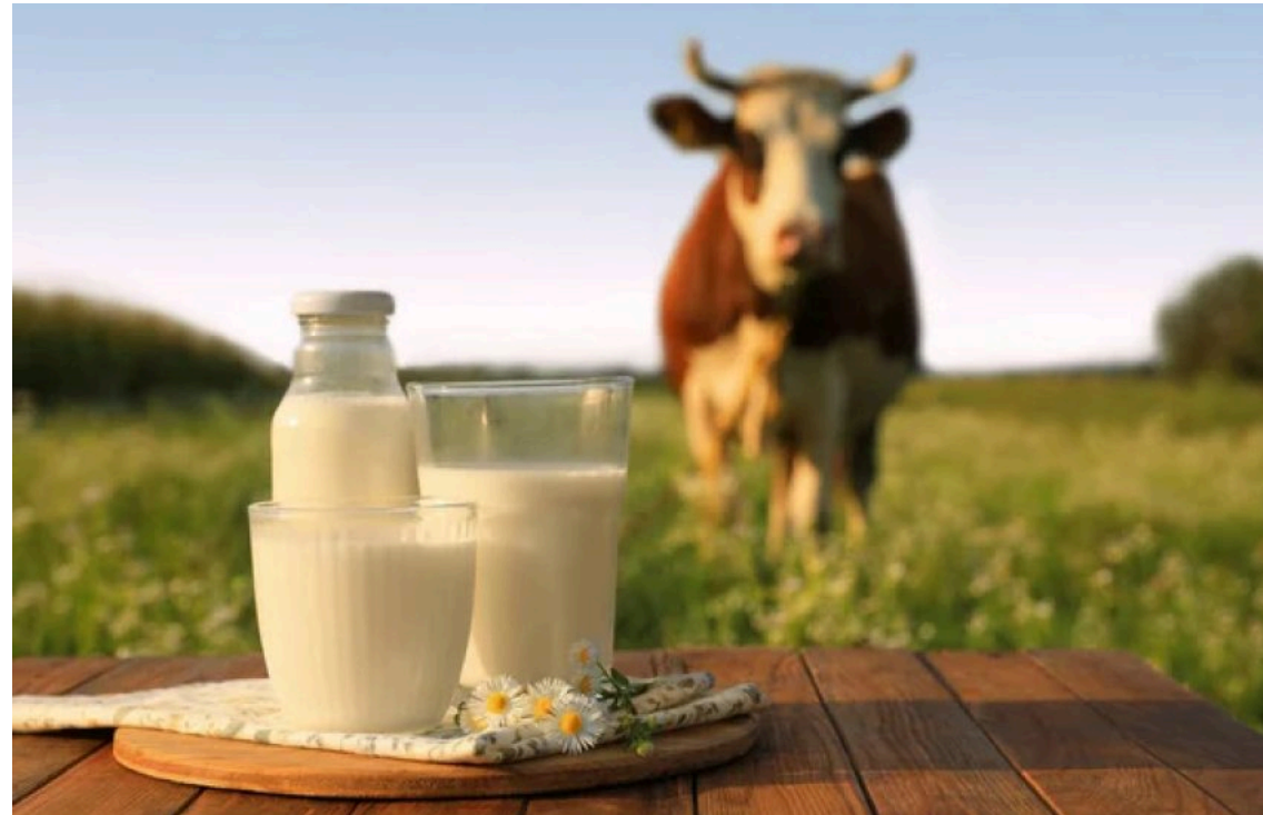
У Лисянці запрацював перший молокомаат

У центрі селища Лисянка на Черкащині запрацював перший автомат "ЕкоМолоко". Тепер місцеві жителі можуть купувати свіже натуральне молоко напряму від фермерів без жодних посередників.