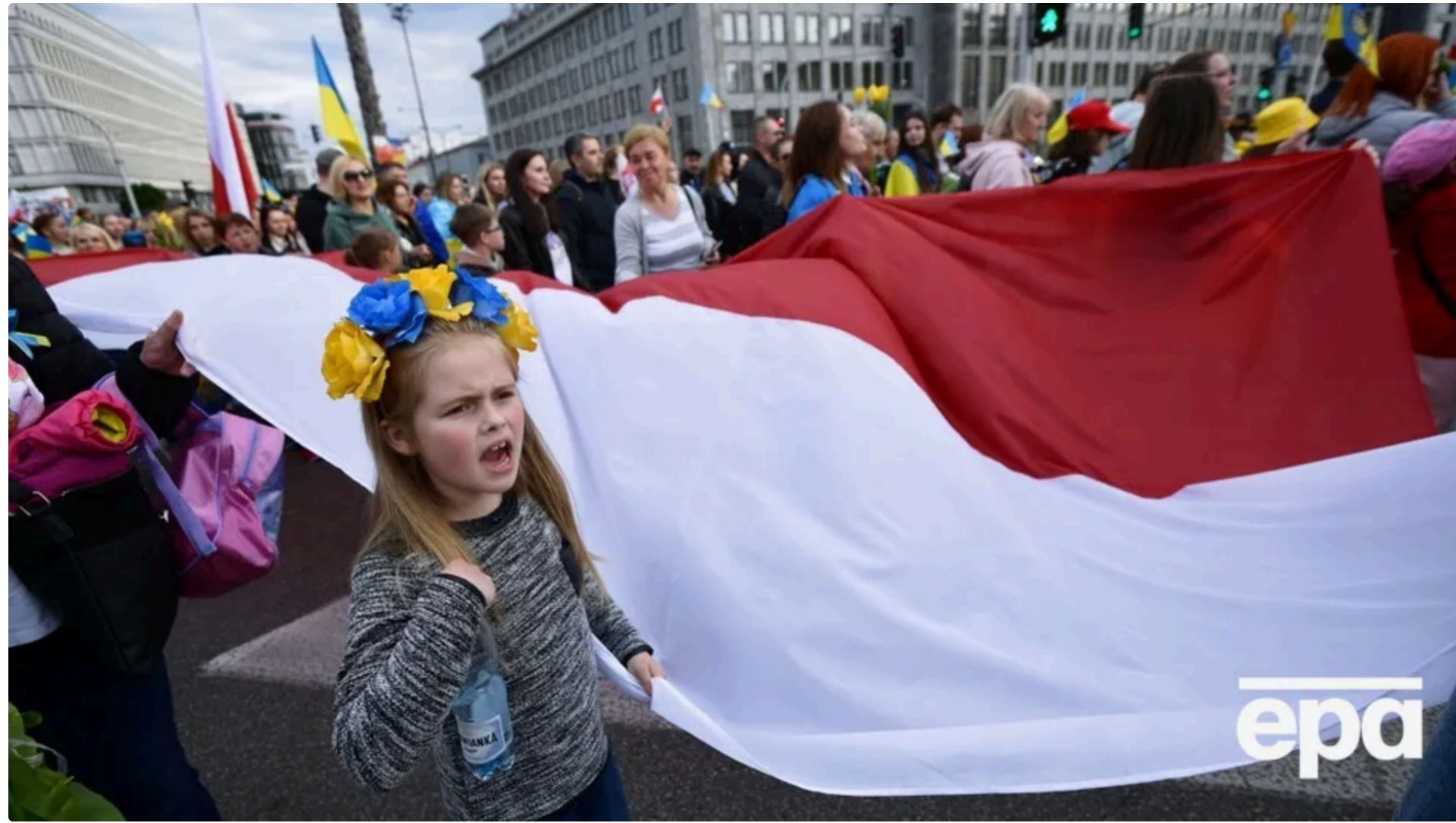
Рішення Зеленського спричинило різку реакцію в Польщі

11 червня, 11:37 🔒 Цей матеріал також можна прочитати на руськом