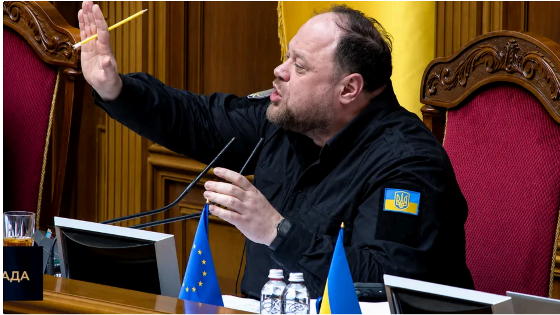
Стефанчук: Треба було вчора сидіти і ставити, а не змотатися і лишити пусті ряди

Під час пленарного засідання Верховної Ради 10 червня спікер Руслан Стефанчук посварився із нардепкою від опозиційної партії "Європейська солідарність" Софією Фединою. Про це повідомляє кореспондентка інтернет-видання "ГОРДОН", трансляцію засідання вів офіційний телеканал ВР.