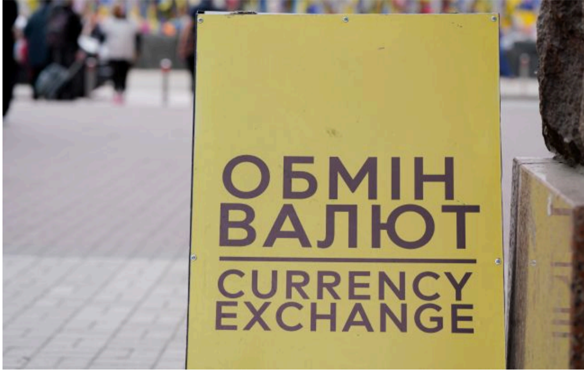
Фото: банки та обмінники оновили курси валют на 11 червня