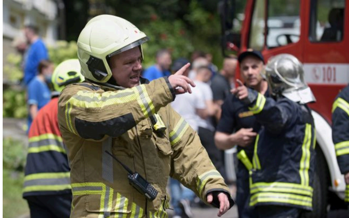
Фото: росіяни вранці атакували Конотоп (Getty Images)