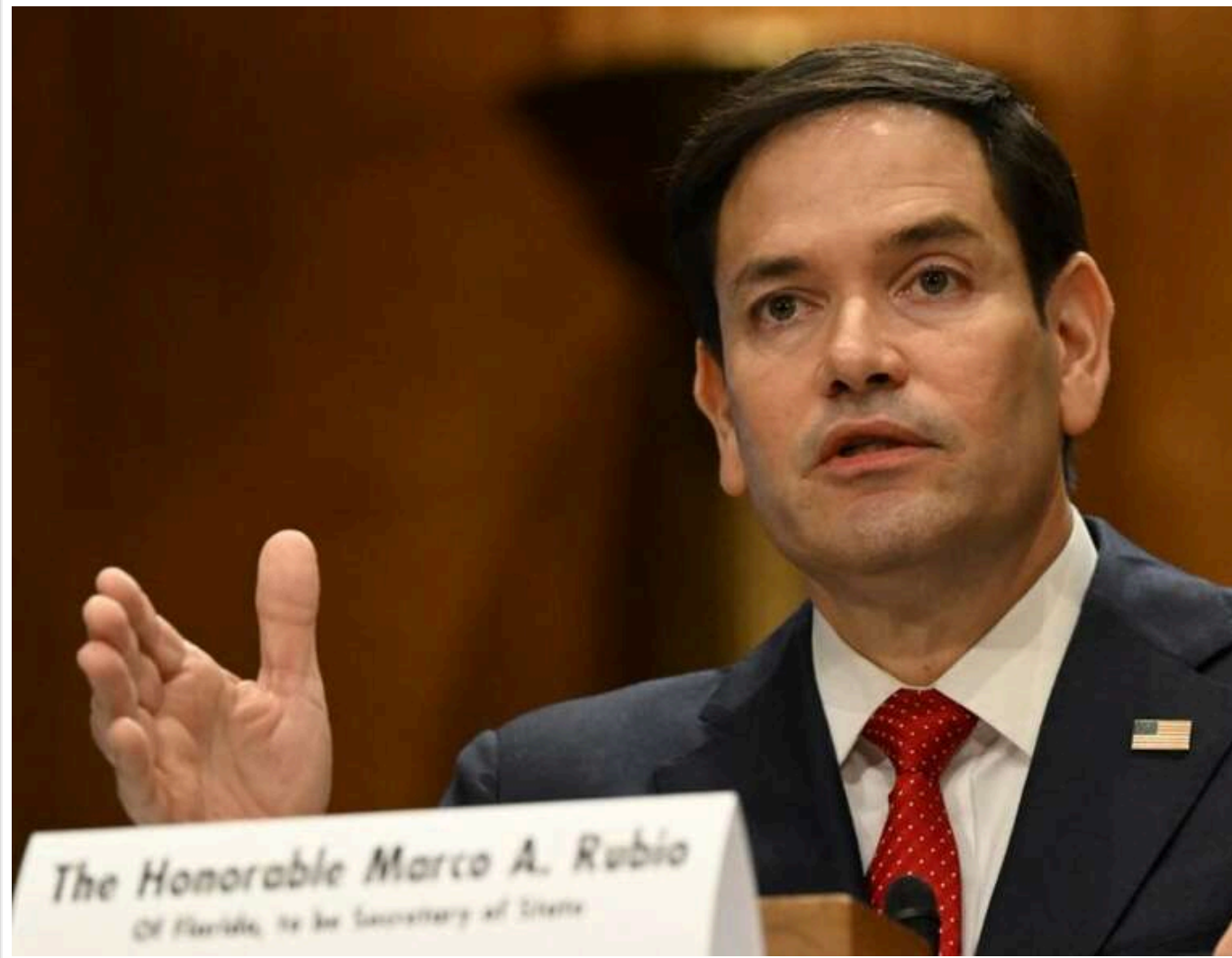
США не прагнуть до розпуску НАТО, але хочуть бачити справжній союз, а не залежність, - Рубіо

Державний секретар США Марко Рубіо заявив, що Вашингтон не виступає за розпуск НАТО, однак закликає союзників рівномірно розподіляти відповідальність у межах Альянсу.