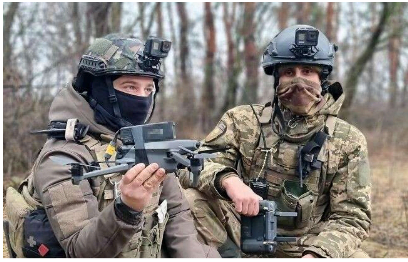
Окупанти самі навели на себе українські дрони: «Підсвічували шлях ліхтариками»

Українські аеророзвідники помітили російських штурмовиків, які вирішили підсвітити своє переміщення звичайними ліхтариками.