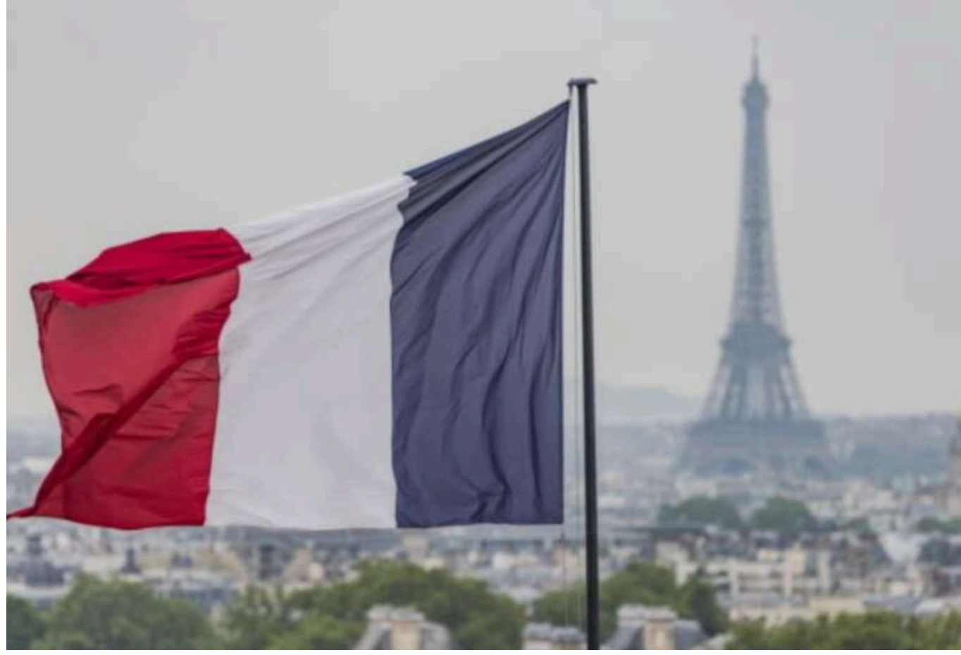
Делегація французьких парламентарів обурена заборонаю в'їзду до Ізраїлю та закликає Макрона втрутитися

Група французьких депутатів висловила незадоволення рішенням ізраїльської влади анулювати їхні візи та закликала президента Франції Еммануеля Макрона засудити цей вчинок.