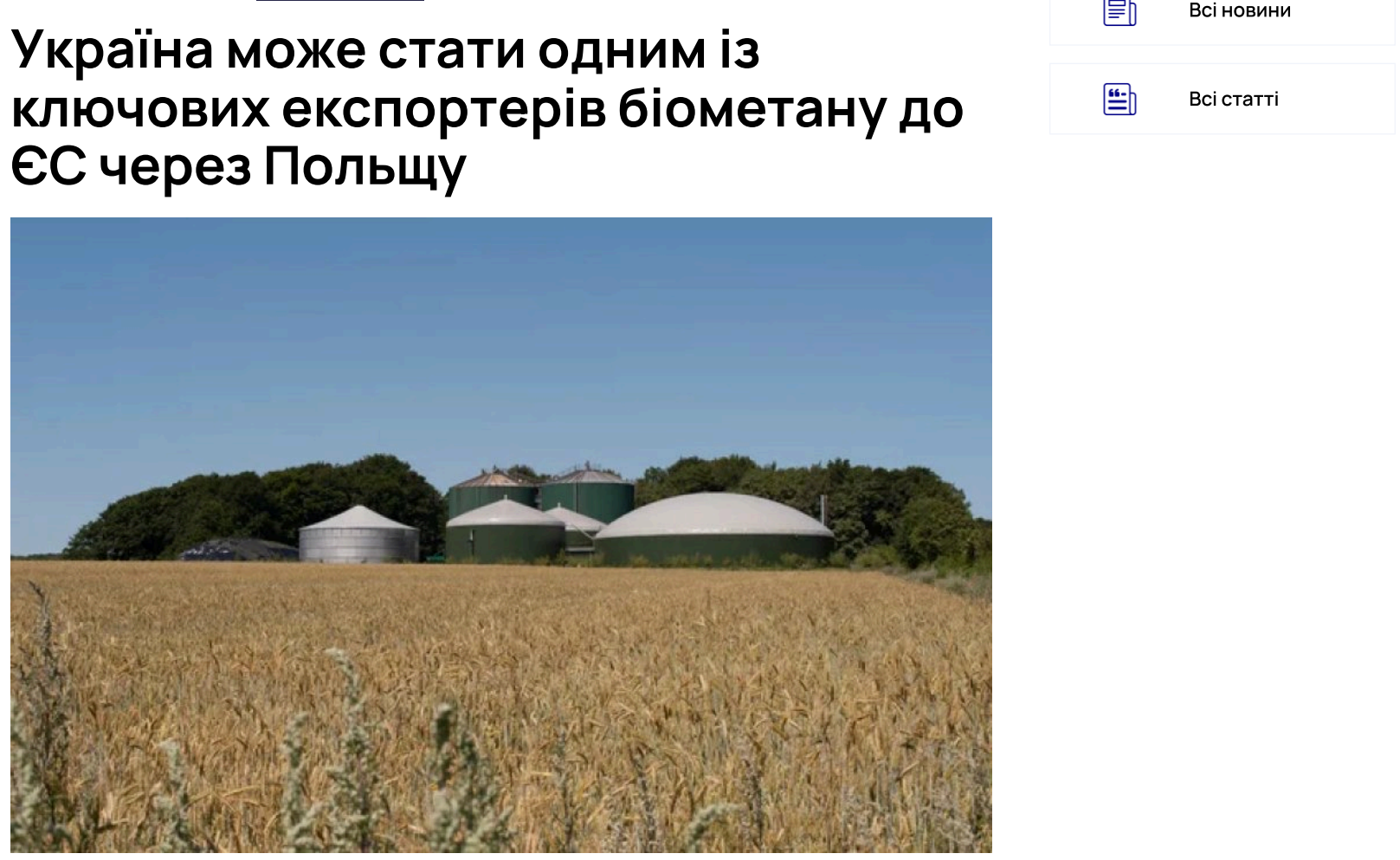
Україна стане топовиробником біометану в Європі

Україна має потенціал увійти до переліку найбільших виробників біометану на європейському континенті, тоді як Польща здатна взяти на себе роль ключового логістичного маршруту для постачання цього палива на ринки ЄС.