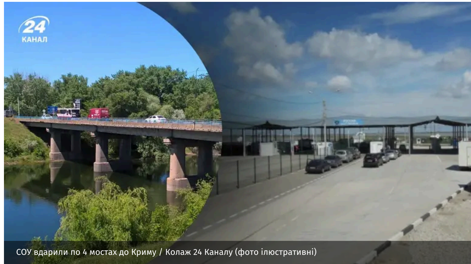
СОУ вдарили по 4 мостах до Криму / Колаж 24 Каналу (фото ілюстративні)

Сили оборони продовжують поступово розширювати зону вогневого контролю над логістичними шляхами росіян. Зокрема, уночі проти 11 червня українські військові вгнали одразу по 4 мостах, які ведуть до Криму.