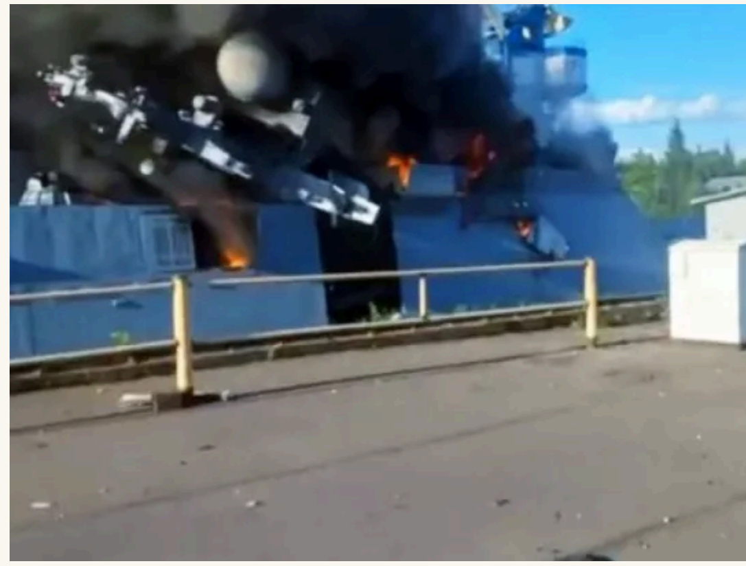
Артем КРАВЧЕНКО, «ФАКТИ»

Російський ракетний корвет «Бойкий», який 3 червня був уражений українськими безпілотниками на території Кронштадтської військово-морської бази, найімовірніше, не підлягає відновленню. Через ту атаку дуже розлютились в кремлі.