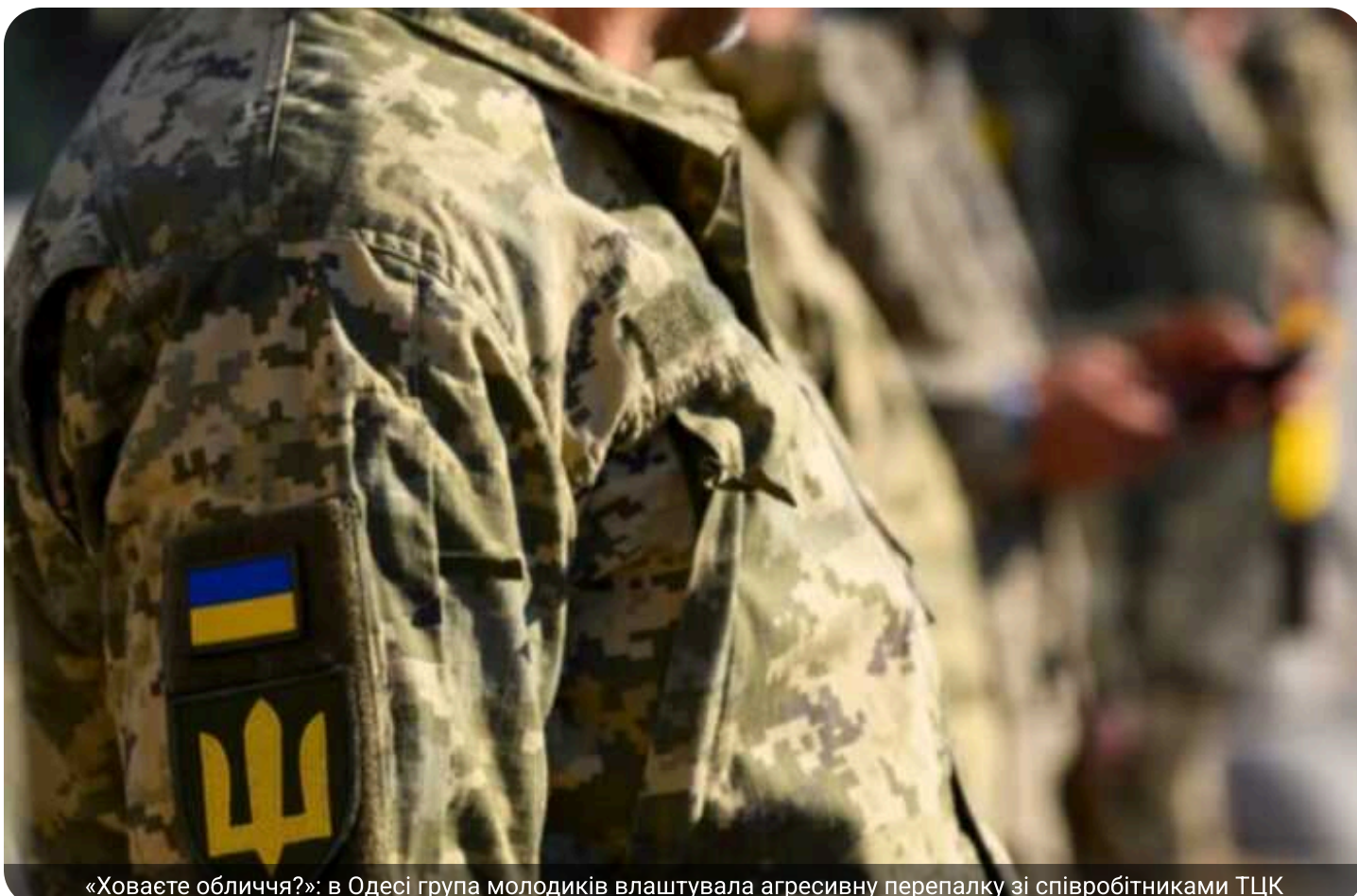
«Ховаєте обличчя?»: в Одесі група молодиків влаштувала агресивну перепалку зі співробітниками ТЦК

В Одесі повідомляють про новий публічний конфлікт між цивільними та працівниками територіального центру комплектування та соціальної підтримки.