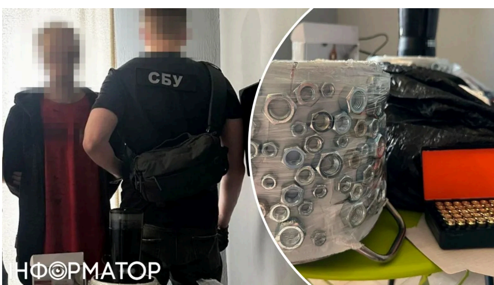
Завербований безробітний споряджав бомби у прифронтовому місті

Контррозвідка зупинила нову хвилю терактів у Харкові - безробітного, якого ФСБ відрядила до міста зі спеціальним завданням, спіймали просто під час сеансу відеозв'язку з російським куратором. Виконавцем став мешканець Кіровоградщини, якого завербували через Telegram-канали з пошуку підробітків. Агенту повідомили про підозру в готуванні до теракту, йому загрожує до 12 років позбавлення волі.