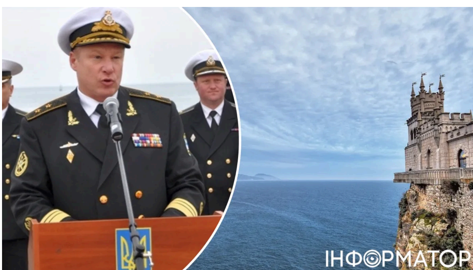
Вирок ухвалили заочно.

Колишній перший заступник командувача ВМС України Сергій Єлісеєв отримав вирок за державну зраду - суд призначив йому 15 років позбавлення волі та позбавив військового звання. Подібні справи показують , що Україна невідворотно переслідує всіх, хто обрав бік ворога. Справа Єлісеєва - один із найгучніших прецедентів зради серед вищого командного складу. Вирок ухвалено заочно - сам засуджений перебуває на службі у Росії.