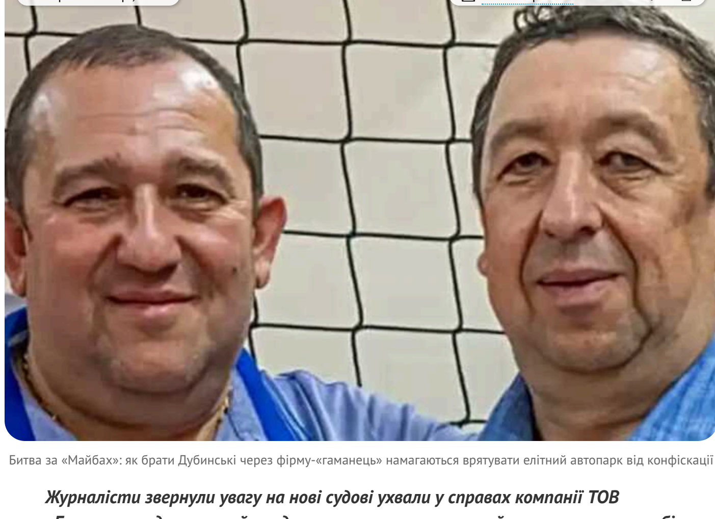
Битва за «Майбах»: як брати Дубинські через фірму-«гаманець» намагаються врятувати елітний автопарк від конфіскації

Журналісти звернули увагу на нові судові ухвали у справою компанії ТОВ «Бронтерм», де основний предмет спору стосується майна, зокрема автомобіля Mercedes-Benz Maybach S580, а не безпосередньо фінансової суті розслідувань.