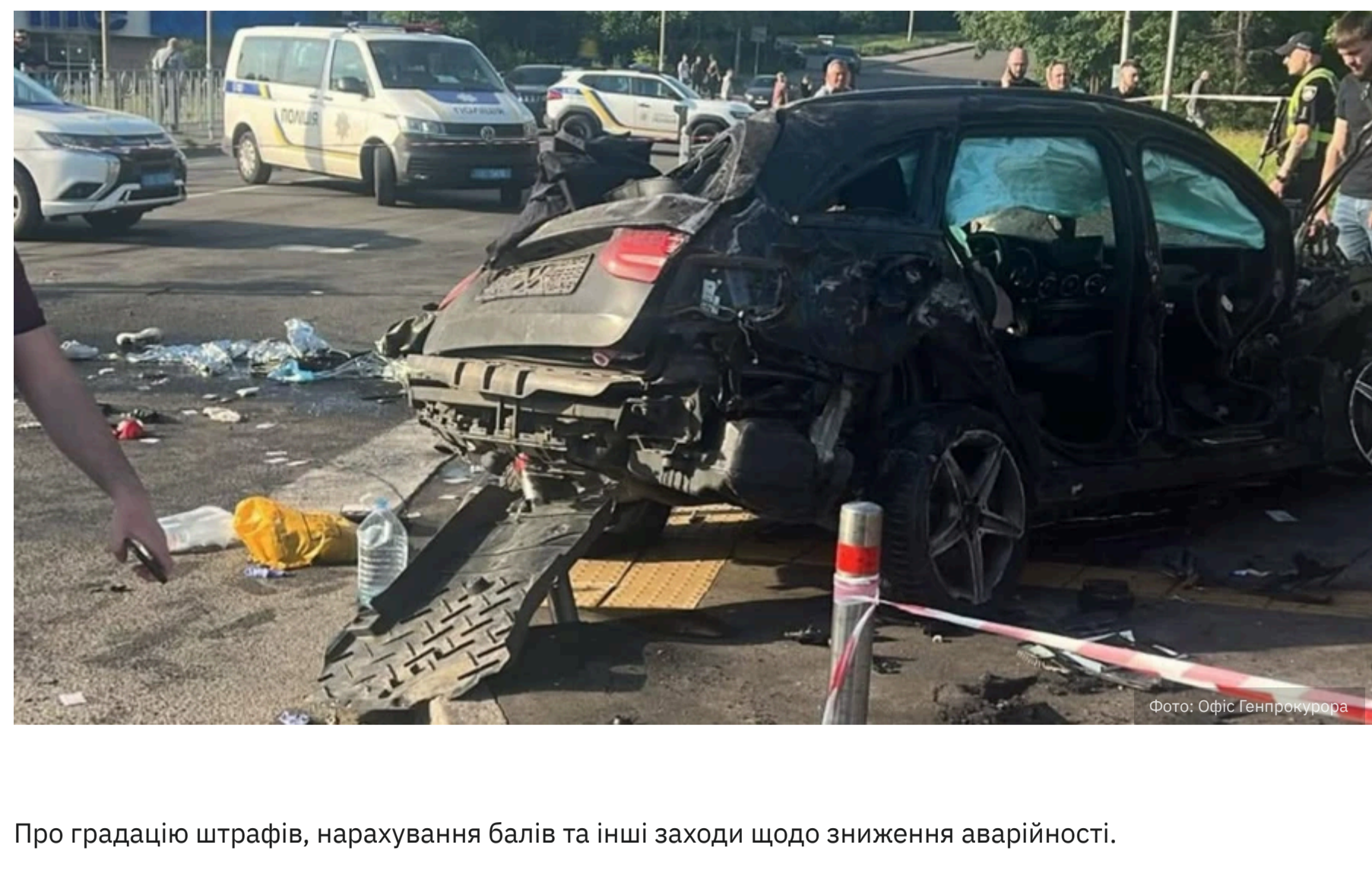
ДТП на Чоколівському бульварі показала, що для пішоходів немає взагалі безпечних місць.

Про градацію штрафів, нарахування балів та інші заходи щодо зниження аварійності.