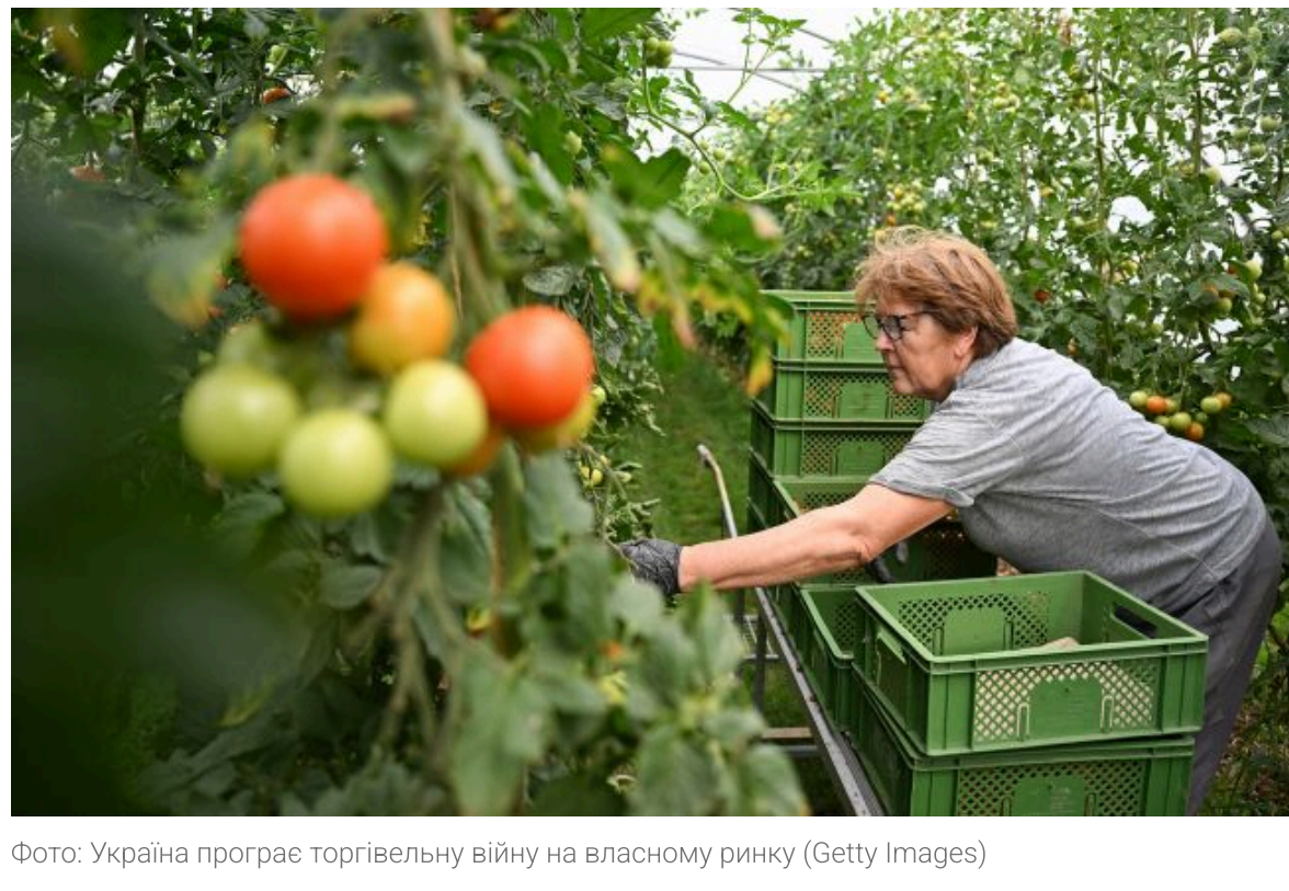
Фото: Україна програє торгівельну війну на власному ринку (Getty Images)

Не витрачай час на шум! Читай тільки суть з РБК-Україна у Google