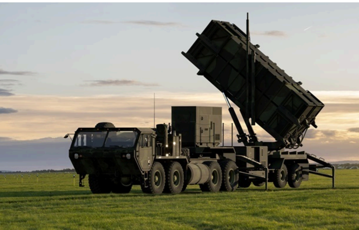
Затримки постачання ракет Patriot викликають серйозне занепокоєння серед союзників США