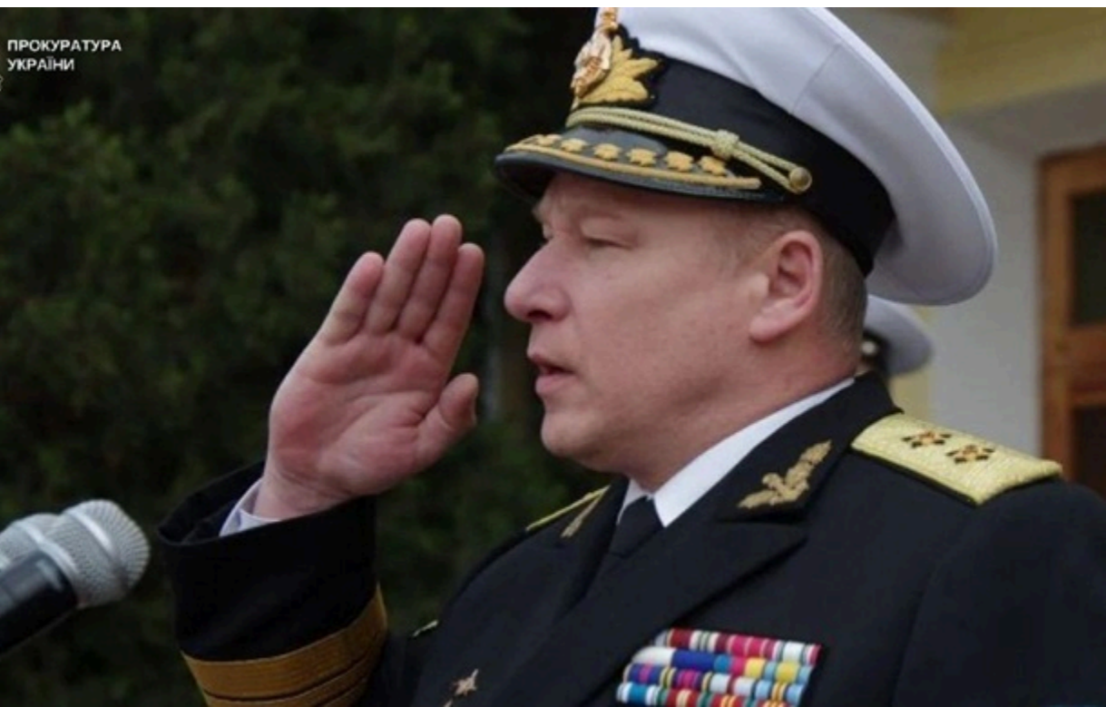
Ексвіцеадмірал ВМС України Сергій Єлісєєв, який перейшов на бік Росії

Сергія Єлісєєва, який перейшов на бік ворога та зробив кар'єру у флоті РФ, засуджено до 15 років ув'язнення.