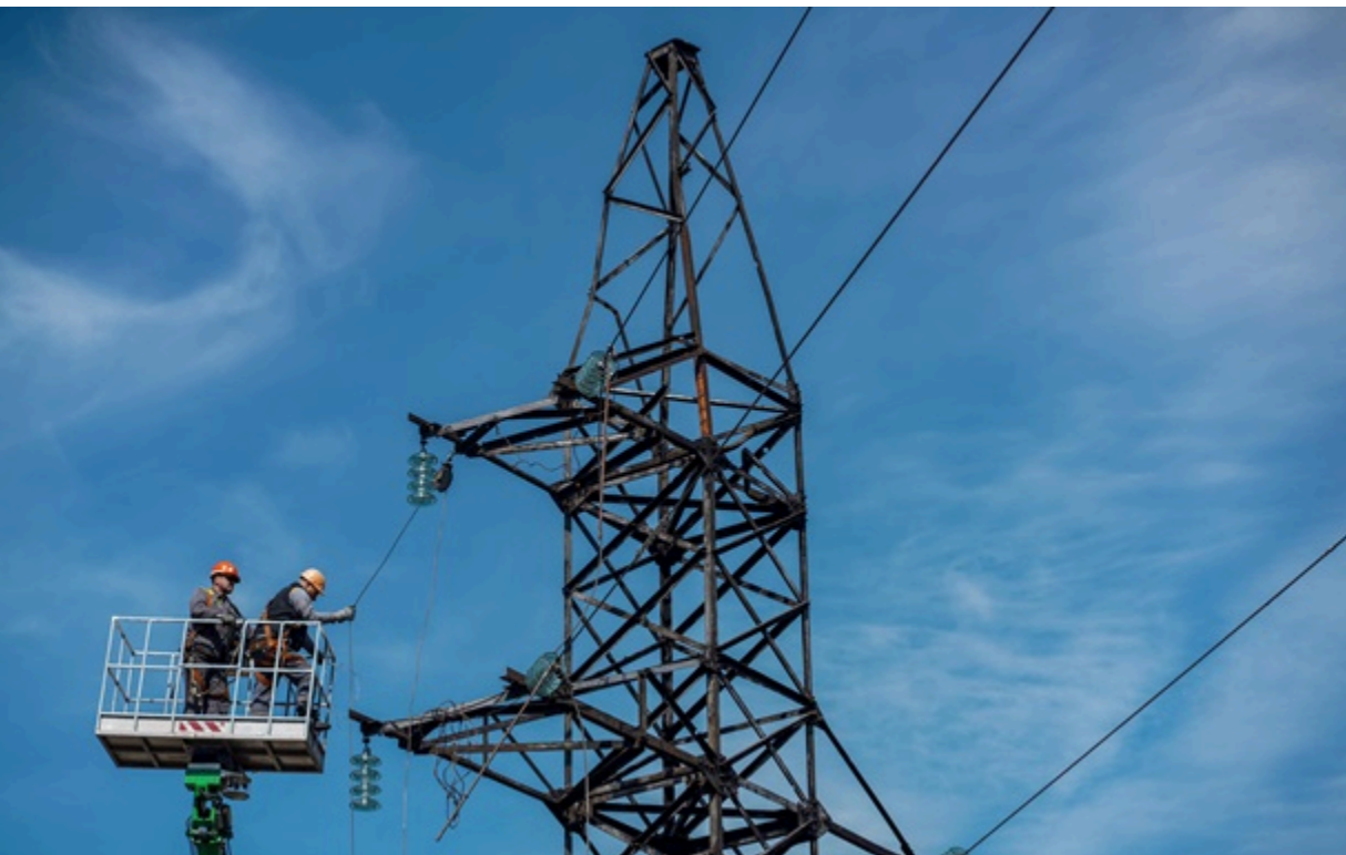
Тривають аварійно-відновлювальні роботи

Поточне повне знеструмлення Запорізької АЕС – вже 19 з початку повномасштабного вторгнення Росії.