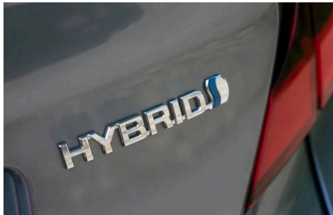
Електромобілі та гібриди відвоюють ринок

У травні автопарк України поповнили майже 3,3 тис. гібридних легкових автомобілів HEV і PHEV. Це на 9% більше, ніж за аналогічний період торік.