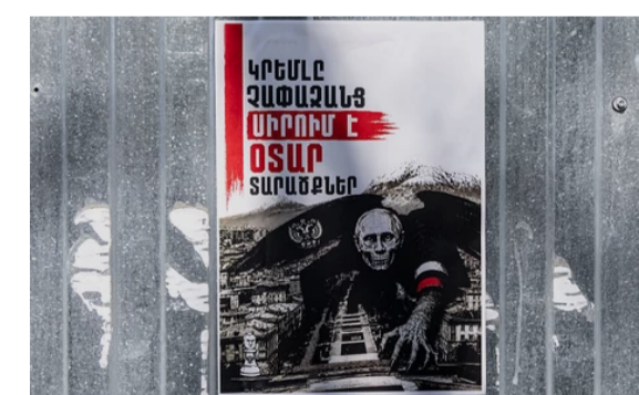
8 червня політика

"Човниковий дипломат" Путіна: як Абрамович балансує між Києвом, Москвою та Заходом