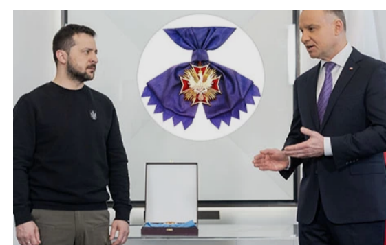
10 червня політика

На межі абсурду: поляки хочуть позбавити Зеленського ордена Білого Орла, а Муссоліні його залишили