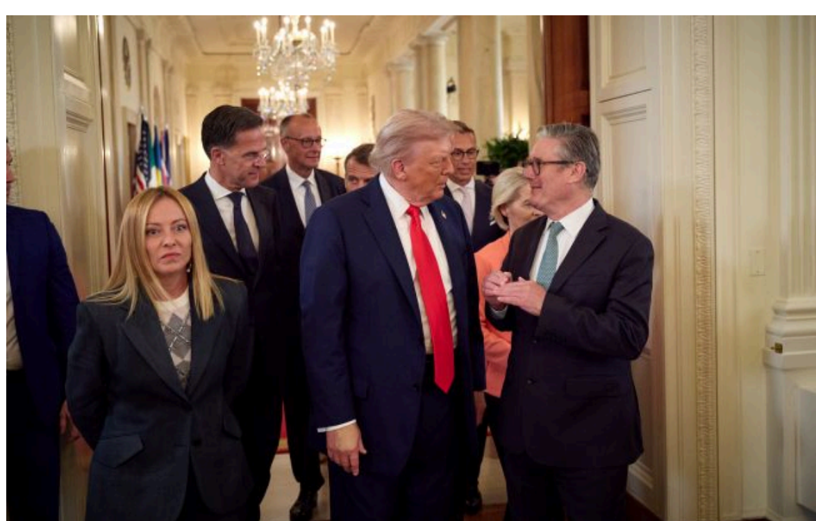
Фото: у Європі спробують переконати Трампа підтримати переговори з РФ