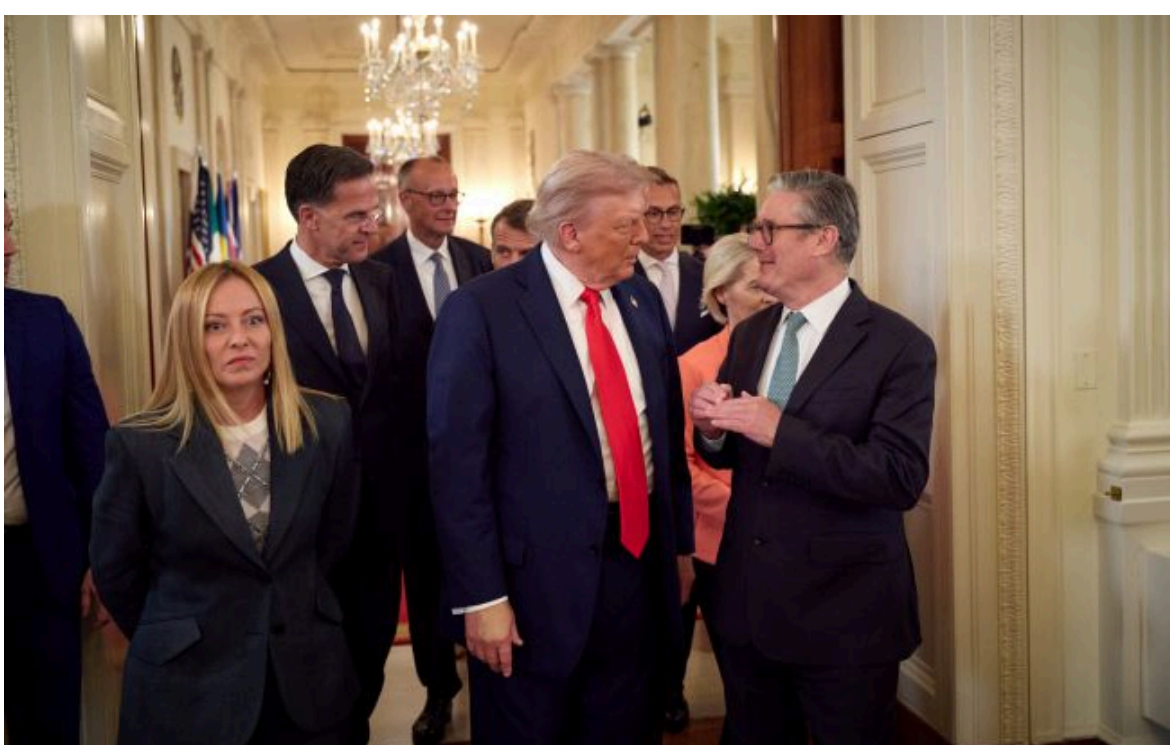
Фото: у Європі спробують переконати Трампа підтримати переговори з РФ