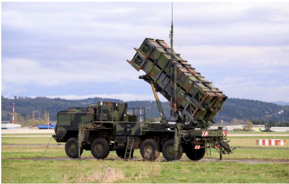
Фото: виробник Patriot зробив тривожну заяву щодо постачання ракет (Getty Images)