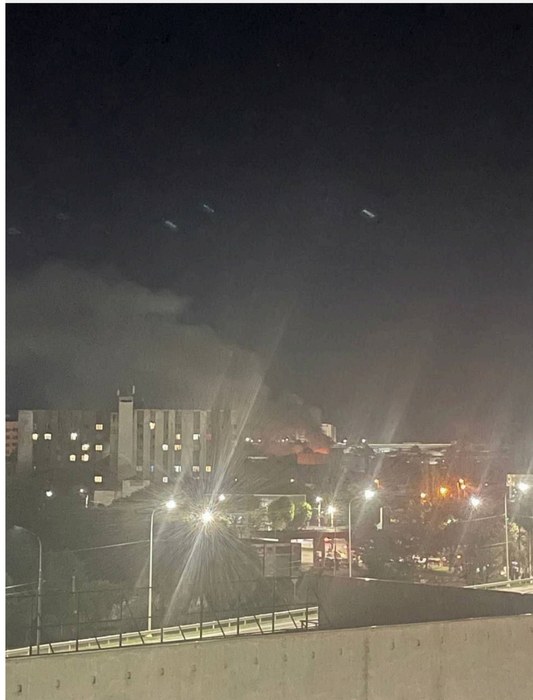
Севастополь перебував під атакою БПЛА кілька годин – у місті лунали вибухи.

За даними OSINT-аналітиків, у районі Стрільцької бухти на територія кадетського та вищого військово-морського училищ розміщені зенітні ракетні комплекси «Тор» і «Панцир». На східному березі бухти базується 68-ма окрема бригада кораблів охорони водного району Чорноморського флоту РФ. Куди точно прийшов удар і якими засобами його завдано – наразі не встановлено.