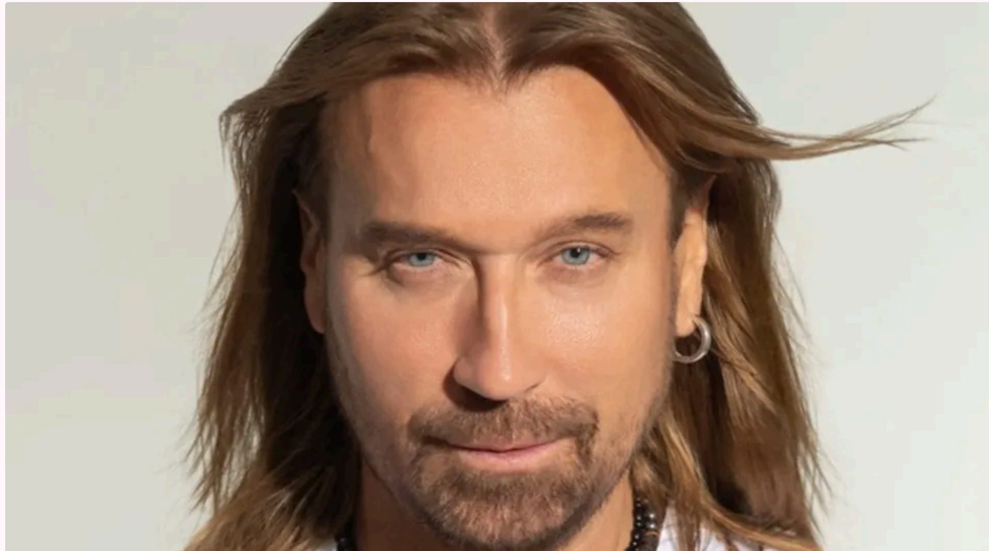
Винник здивувався, що за можливість записати з ним інтерв'ю шахраї отримали кошти

11 червня, 08.41 Этот материал также можно прочитать на русском