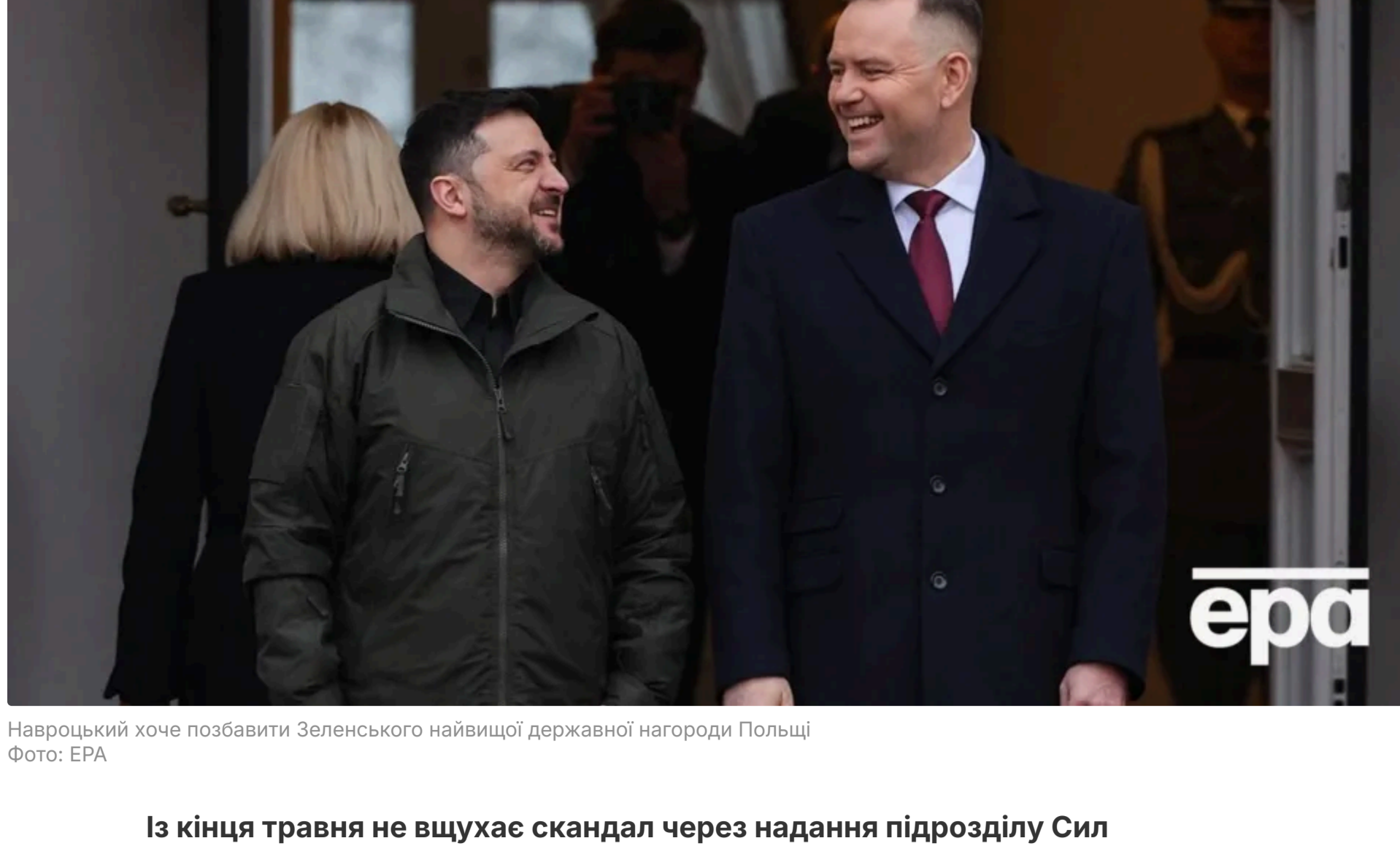
Навродцький хоче позбавити Зеленського найвищої державної нагороди Польщі

11 червня, 09:06 Цей матеріал також можна прочитати на руському