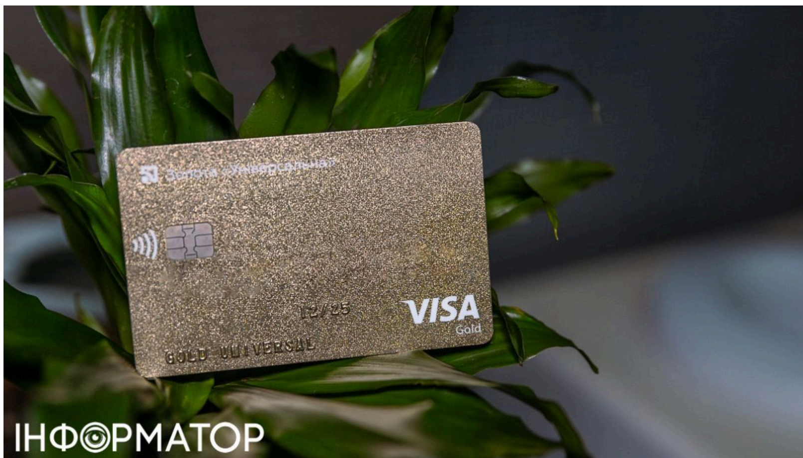
Картка ПриватБанку

Приморський районний суд Одеси задовольнив позов ПриватБанку та зобов'язав боржника повернути понад 69 тисяч гривень кредитної заборгованості. Подібний кредитний спір в Одесі вже розглядався раніше - банк системно стягує прострочені борги через суди по всій країні. Рішення ухвалено 2 червня 2026 року в порядку заочного провадження - відповідач у засіданні не з'явився. Суддя Науменко А.В. проголосив лише вступну та резолютивну частини рішення, а повний текст буде виготовлений протягом п'яти днів.