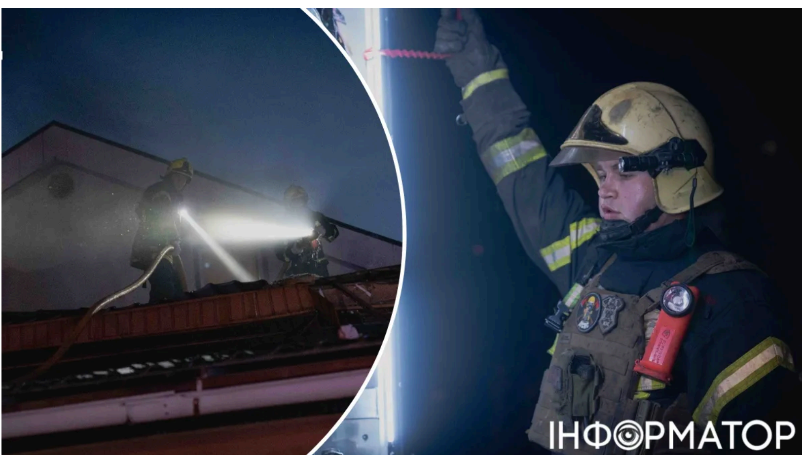
Конотоп без газу і світла після удару РФ

Росія вдарила по Конотопу вночі та вранці 11 червня. Місто залишилося без газу, електроенергії та водопостачання. Ворог знову прицільно вдарив по цивільній інфраструктурі. Одна мешканка отримала поранення уламком і проходить лікування амбулаторно.