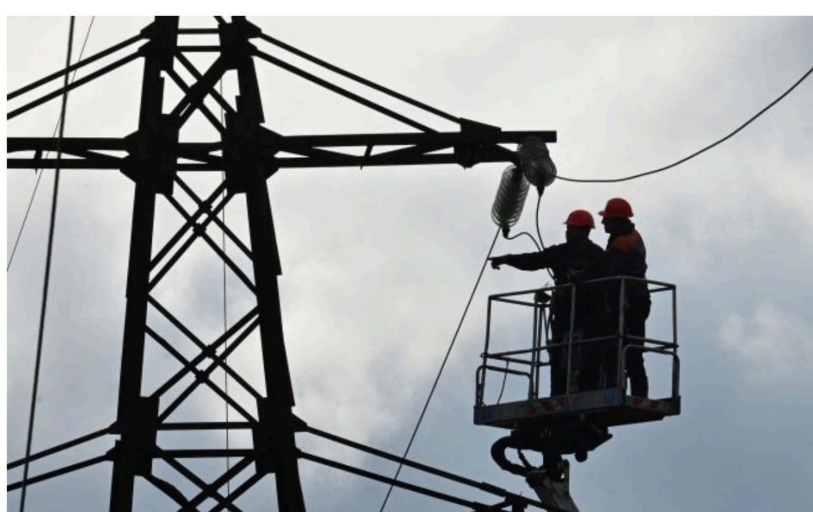
Фото: Конотоп залишився без води та світла через атаку РФ (Getty Images)