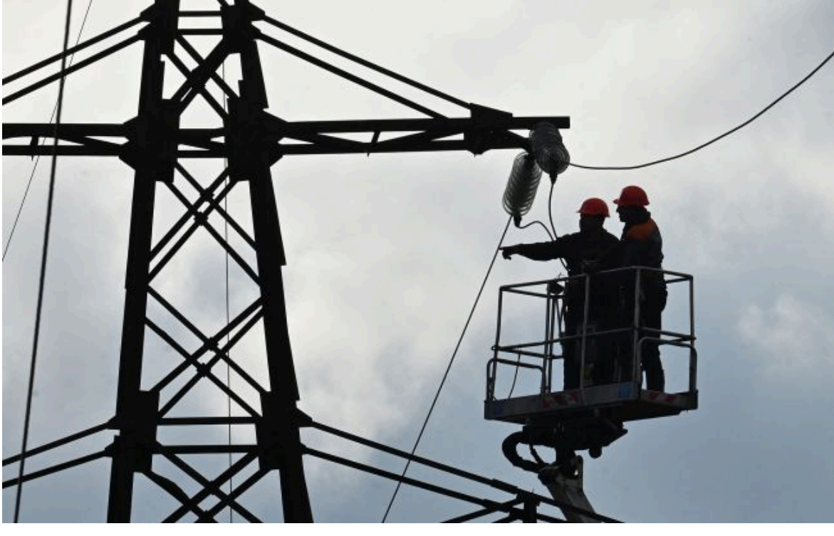
Фото: Конотоп залишився без води та світла через атаку РФ