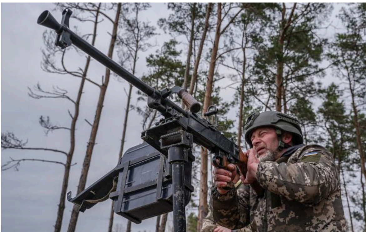
Фото: українські захисники збили 195 дронів