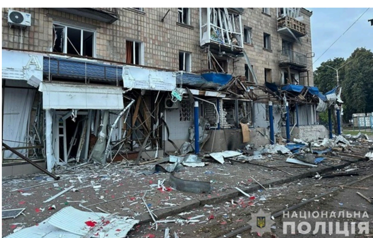
Наслідки попередніх російських атак на Конотоп

Є пошкодження житлових будинків. Також військові РФ влучили по транспортній інфраструктурі міста.