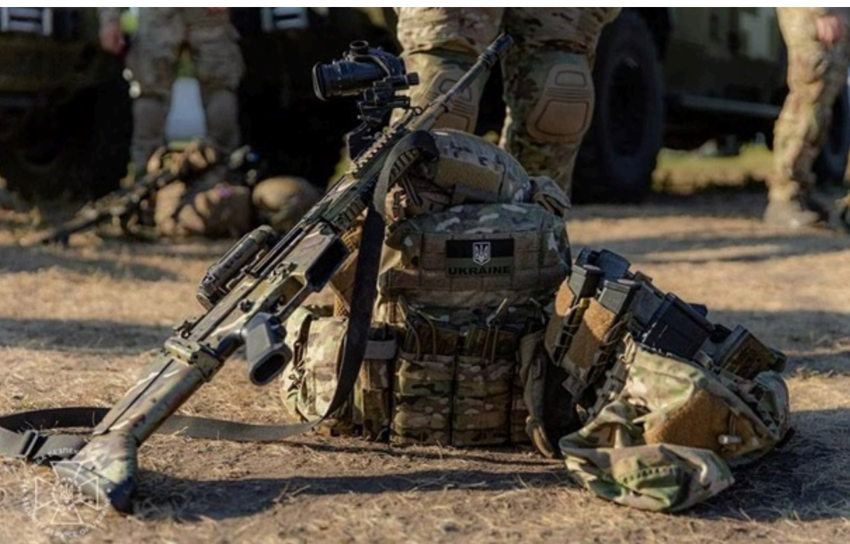
У Генштабі пояснили, від чого залежатиме демобілізація військових

Чим вищими будуть показники призову в армію, тим більше можливостей з'явиться для звільнення військових.