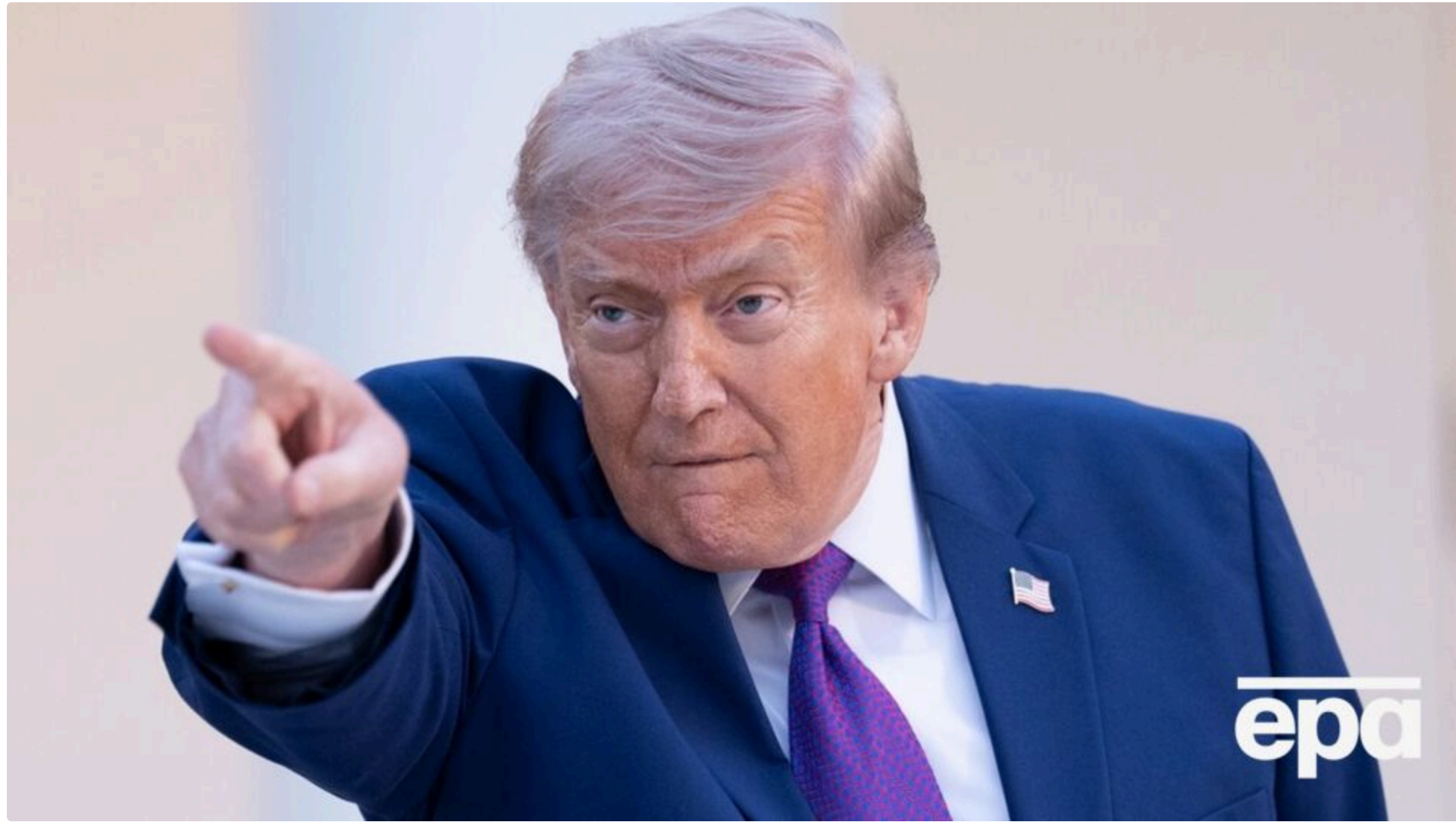
Трамп поскаржився на недосягнення угоди з Іраном

11 червня, 08.10 🗨️ Етот материал также можно прочитать на русском