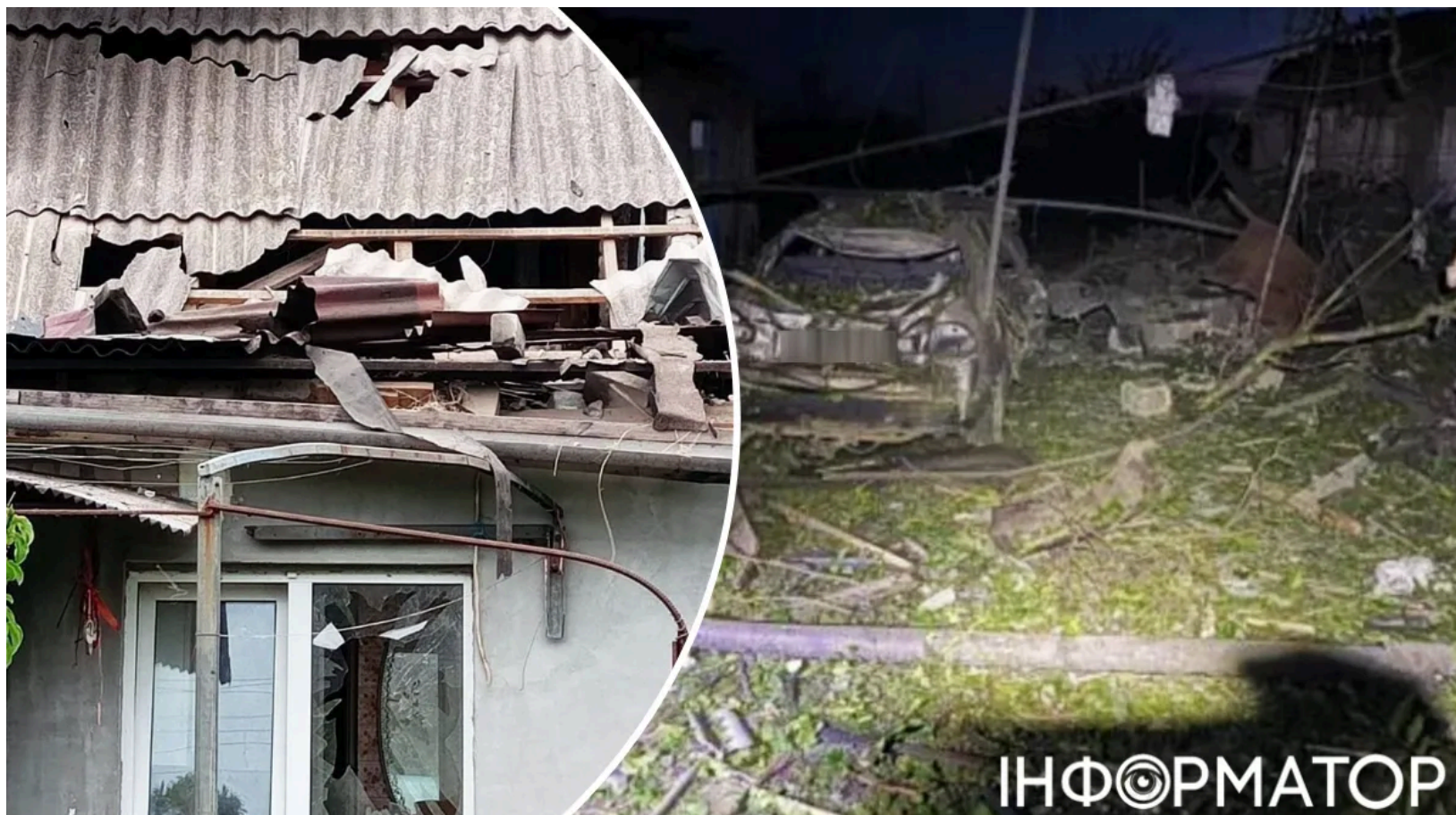
Наслідки удару КАБами по Запоріжжю.

Троє мешканців Запорізького району постраждали від удару керованими авіабомбами, який Росія завдала ввечері 10 червня. Під удар потрапила Новомиколаївка - двоє чоловіків і жінка дістали поранень різного ступеня тяжкості. Зараз усі троє перебувають під наглядом медиків. Окрім людей, постраждало і майно: пошкоджені приватні будинки та один автомобіль.