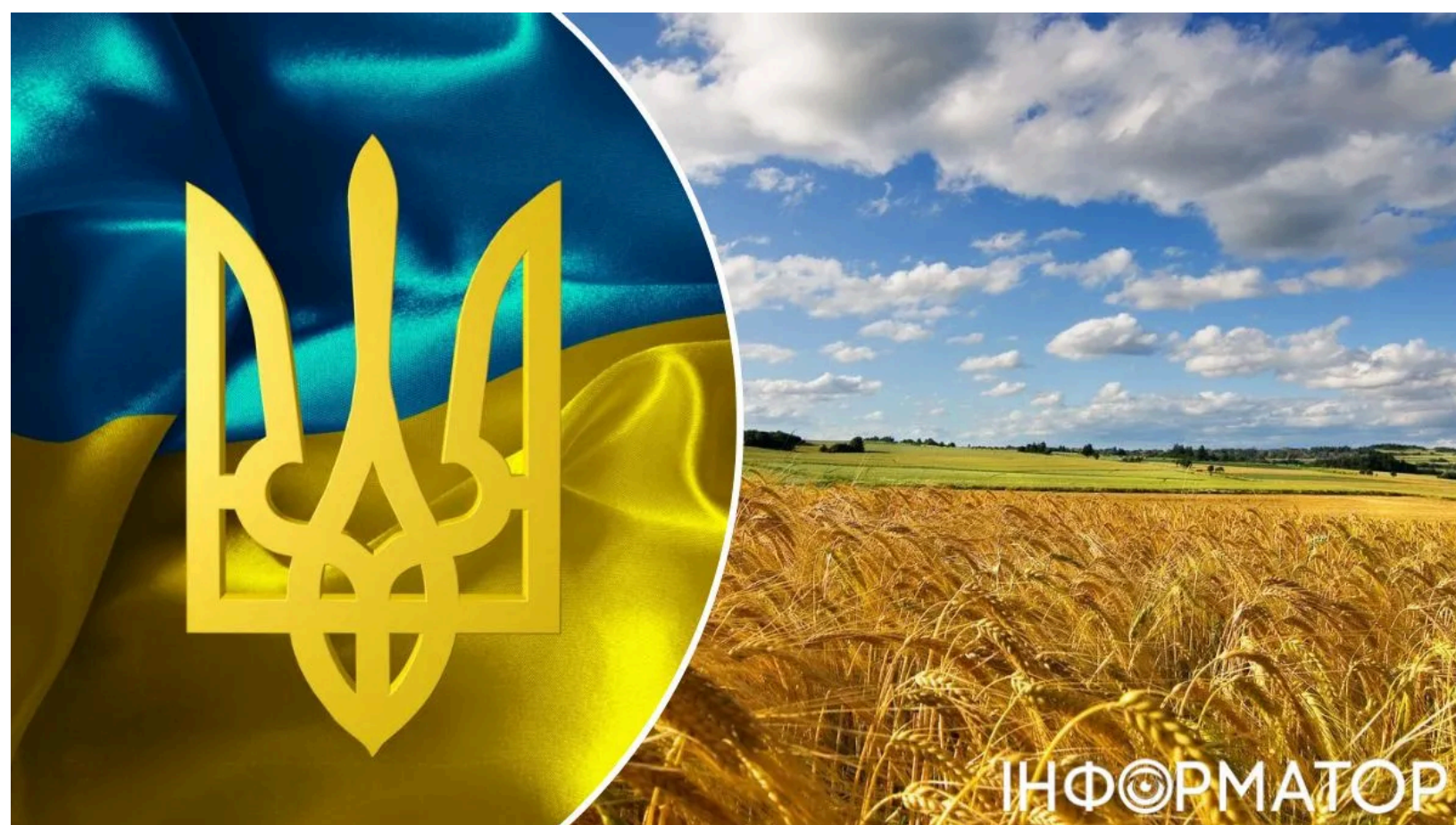
Який вирок за зневагу до символів держави

Публічна наруга над Державним Прапором, Гербом чи Гімном України є кримінальним злочином - за це загрожує штраф або позбавлення волі на строк до трьох років. В умовах повномасштабної війни, коли державні символи стали уособленням незламності та мужності українців, правова захищеність цих атрибутів набуває особливої ваги. Законодавство чітко визначає як перелік можливих покарань, так і конкретні способи вчинення цього злочину.