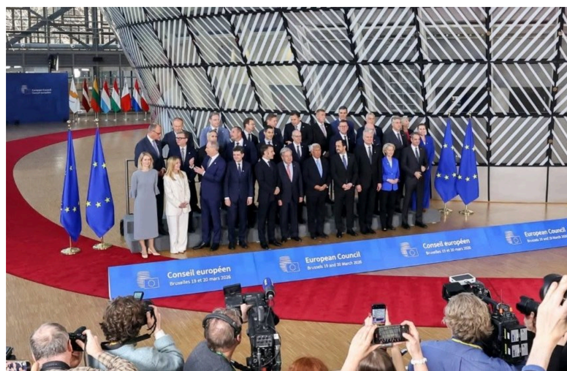
Україні ЄС не можуть домовитись, що робити з 6,6 млрд євро з Європейського фонду миру, які розблокувала Угорщина.

Німеччина пропонує, щоб €6,6 мільярда з Європейського фонду миру, які розблокувала Угорщина, передали Україні. З цим не погоджується Польща і планує боротися за кожен євро й отримати приблизно €450 мільйонів відшкодування за зброю, яку передали Україні.