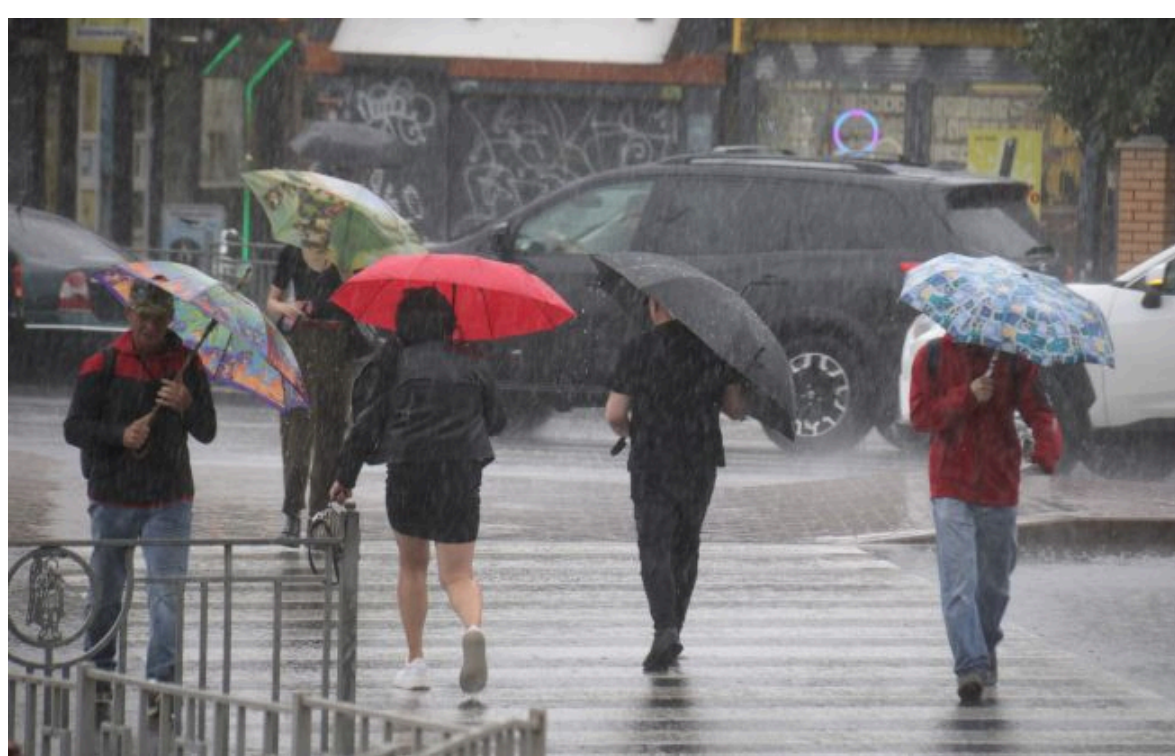
Фото: синоптики дали прогноз погоди на 11 червня

Стихія не застане зненацька! Слідкуй за змінами погоди з РБК-Україна у Google