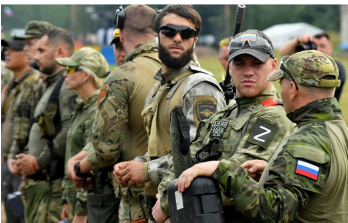
Фото: удари України дронами знизили перевагу РФ у людях

Розумій ситуацію на фронті через факти, а не чутки з РБК-Україна у Google