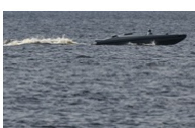
Екіпаж збитого Apache вртував морський дрон - ЗМІ Вчора, 21.33

У Пакистані 10 червня сталася авіакатастрофа за участю військового гелікоптера Mi-17 російського виробництва. Інцидент трапився поблизу міста Музаффарабад, ймовірно, "через технічну несправність на борту". За попередньою інформацією, всі члени екіпажу, які перебували в гелікоптері, загинули. Про це повідомляють регіональні ЗМІ.