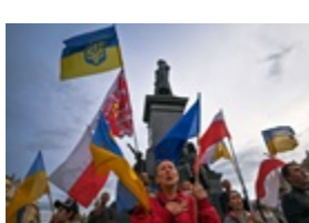
Через рішення Зеленського у 52% поляків погіршилося ставлення до українців

У Росії на 20% впала кількість охочих воювати проти України - ISW Країни Перської затоки пригрозили Ірану відповіддю за атаки