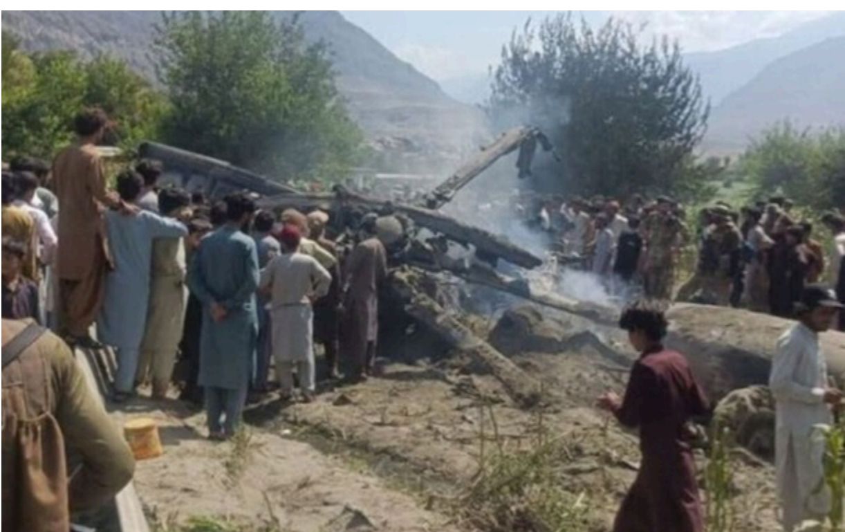
Кількість загиблих військових Пакистану не розголошують

Через "технічну несправність на борту" загинули всі члени екіпажу, які були у гелікоптері російського виробництва.