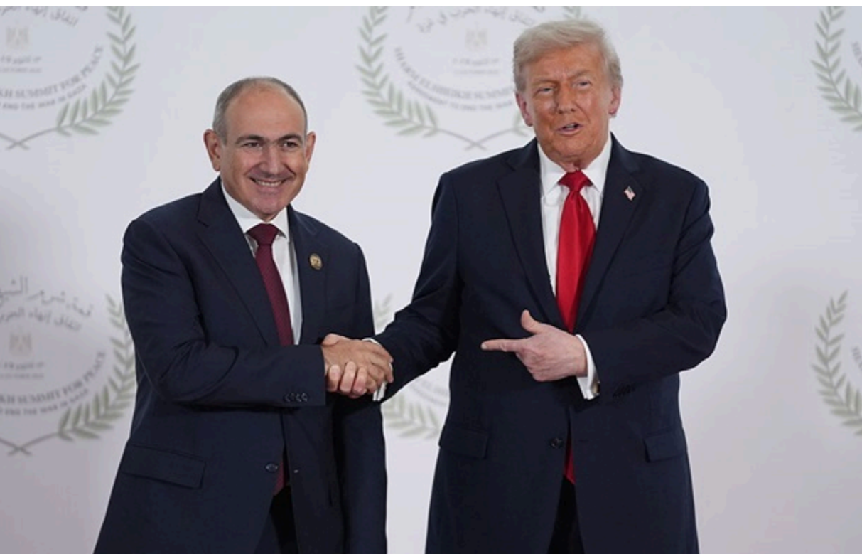
Дональд Трамп підтримував Нікола Пашиняна на виборах Вірменії

Лідер США пишається тим, що підтримав прем'єр-міністра Вірменії у його прагненні переобратися і висловив упевненість у блискучих перспективах країни.