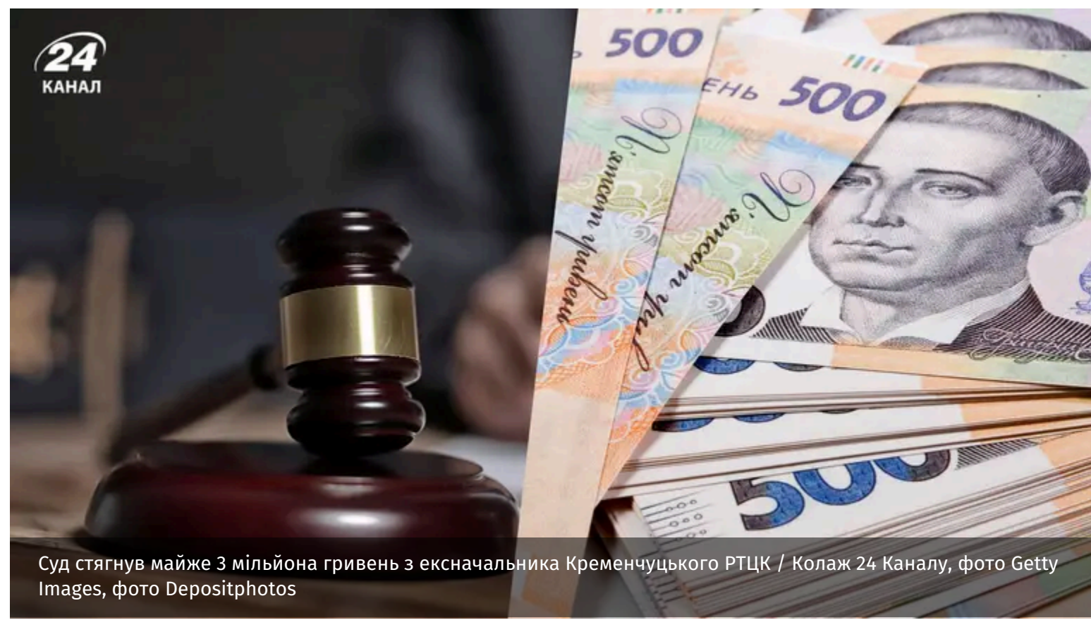
Суд стягнув майже 3 мільйона гривень з ексначальника Кременчуцького РТЦК

Суд стягнув з ексначальника Кременчуцького РТЦК майже 3 мільйони гривень. У ВАКС зазначили, що він придбав майно, яке не відповідає офіційним доходам.