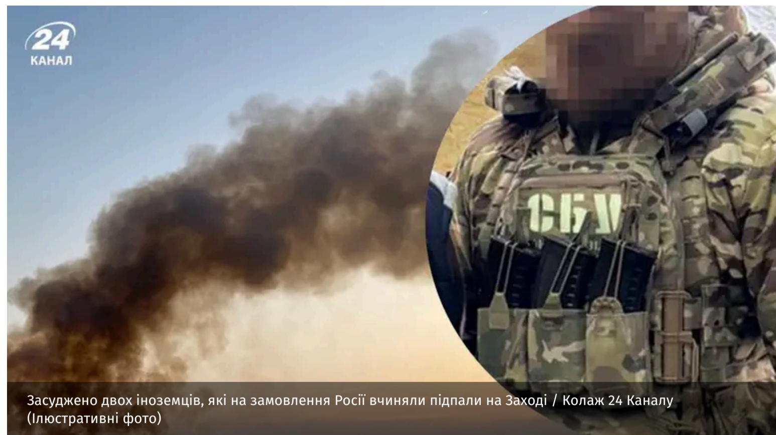
Засуджено двох іноземців, які на замовлення Росії вчиняли підпали на Заході / Колаж 24 Каналу (Ілюстративні фото)

На Івано-Франківщині співробітники СБУ викрили двох іноземців, які працювали на російській спецслужбі. Фігуранти займались підпалами у західних регіонах України.