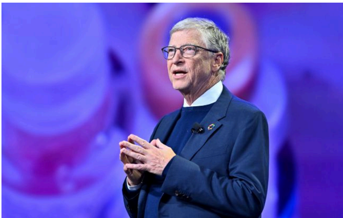
Фото: мільярдер Білл Гейтс