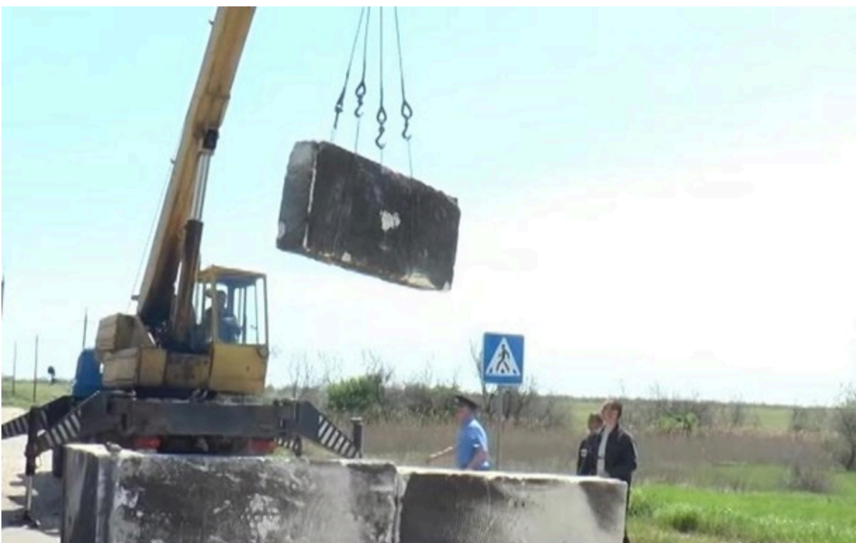
Новий блокпост в Херсонській області

Дороги області контролюють не тільки з боку Криму, а й з боку Одеської, Миколаївської та Запорізької областей.