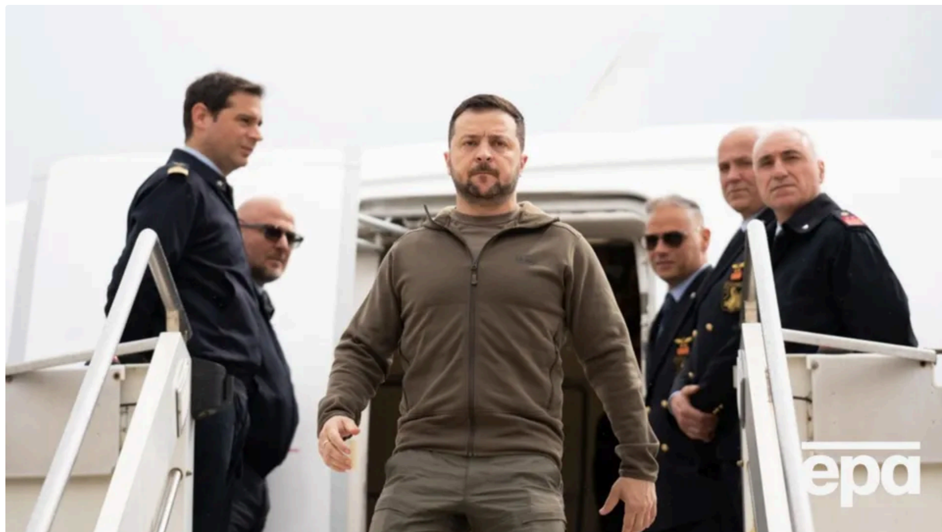
Літак Зеленського приземлився у Кракові

11 червня, 00:58 🗨️ Цей матеріал також можна прочитати на русском