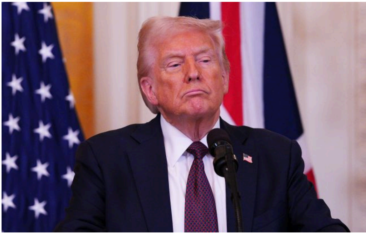
президент США Дональд Трамп

Не витрачай час на шум! Читай тільки суть з РБК-Україна у Google